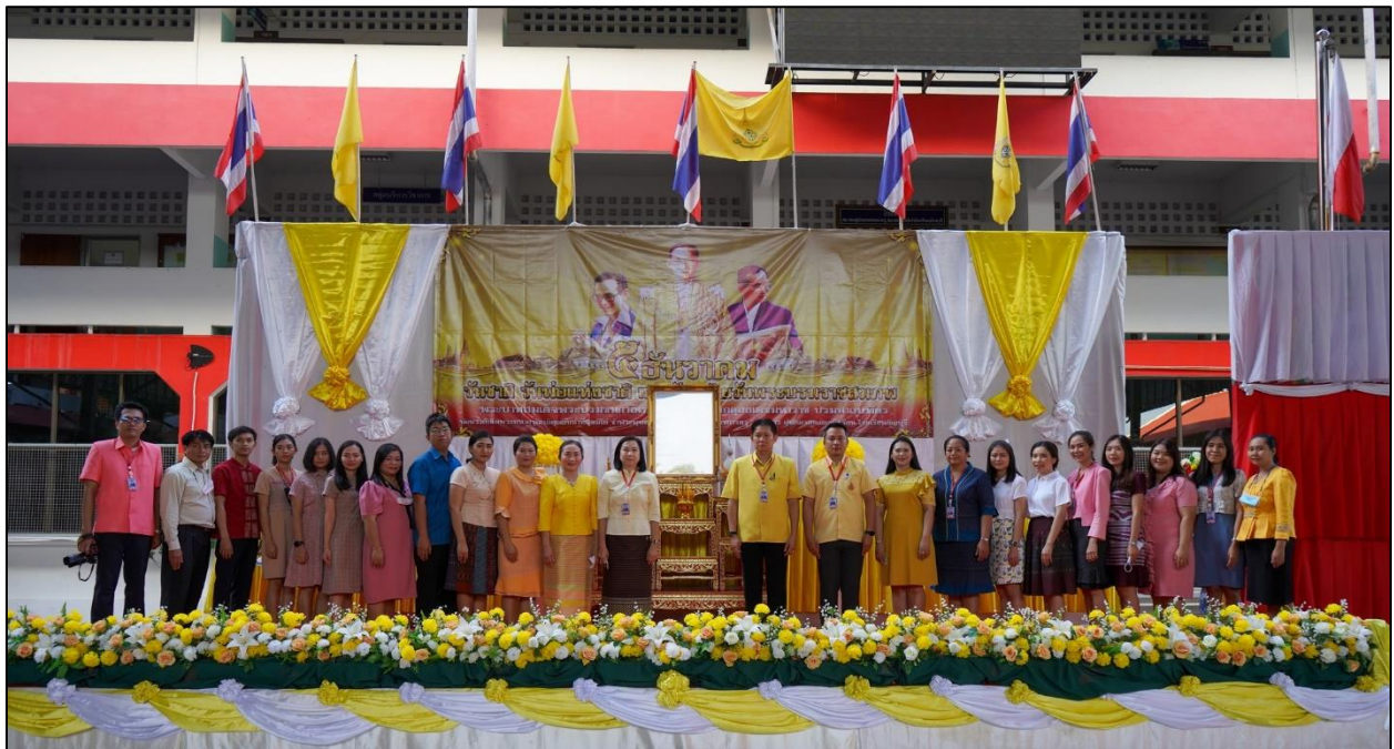
รูปที่ ๑๑ เข้าร่วมกิจกรรมวันพ่อแห่งชาติและวันคล้ายวันพระบรมราชสมภพ "ร.๙" วันที่ ๔ ธันวาคม ๒๕๖๓ ณ ลานกีฬาอเนกประสงค์ โรงเรียนธัญบุรี