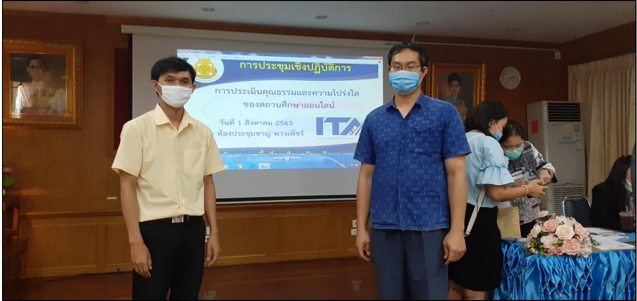
รูปที่ ๑๘ เข้าร่วมประชุมเชิงปฏิบัติการการประเมินคุณธรรมและความโปร่งใส ในการดำเนินงานของสถานศึกษาออนไลน์ วันที่ ๑ สิงหาคม ๒๕๖๓