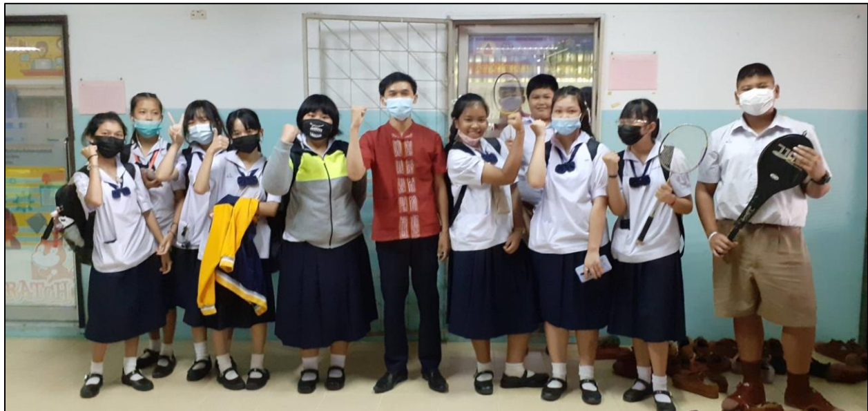
รูปที่ ๓ แสดงความยินดีกับนักเรียนที่ได้รับคัดเลือกเป็นตัวแทนนักกีฬาประจำสีชมพู กีฬาภายใน ประจำปีการศึกษา ๒๕๖๓