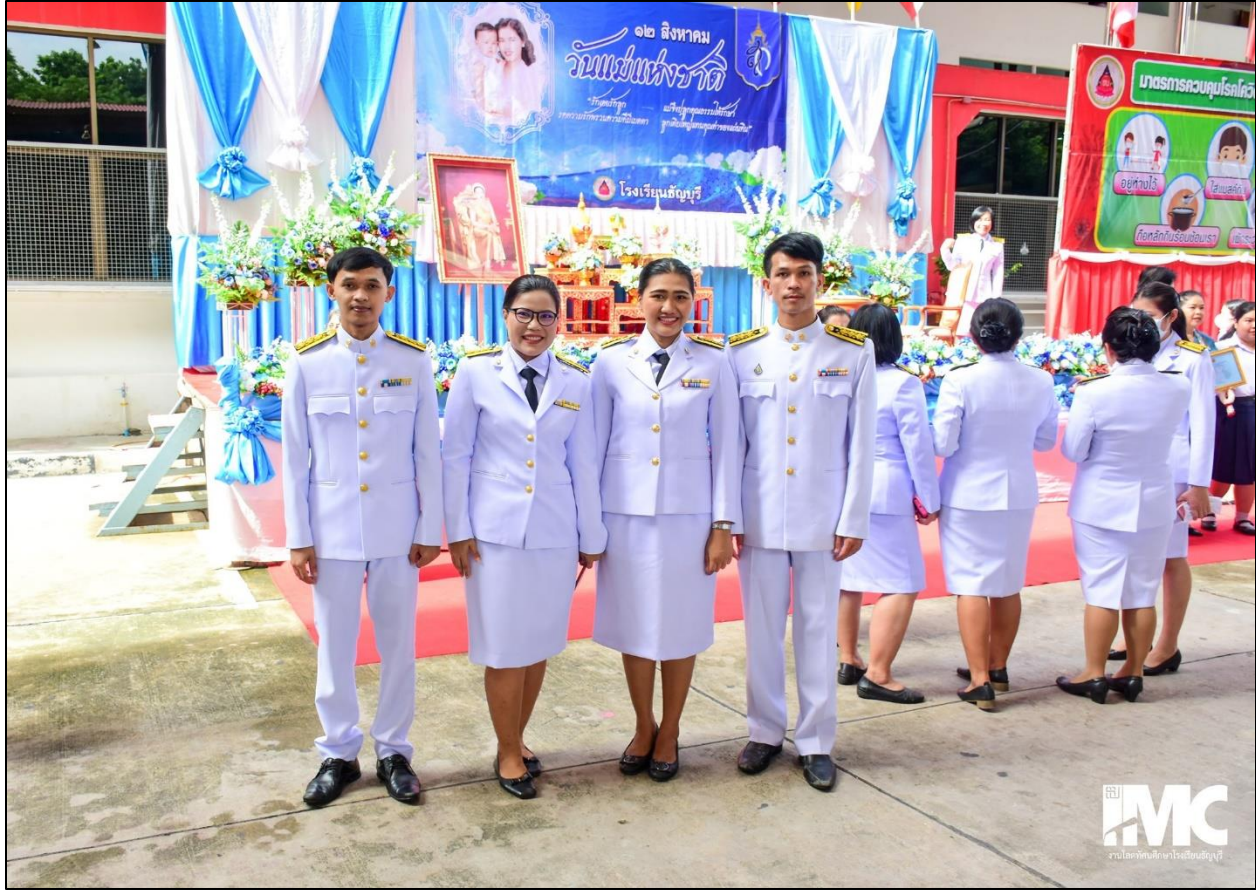
รูปที่ ๑๒ ร่วมพิธีถวายพระพรพระราชนิในรัชกาลที่ ๙ และวันแม่แห่งชาติ วันที่ ๑๐ สิงหาคม ๒๕๖๓ ณ ลานกีฬาอเนกประสงค์ โรงเรียนธัญบุรี