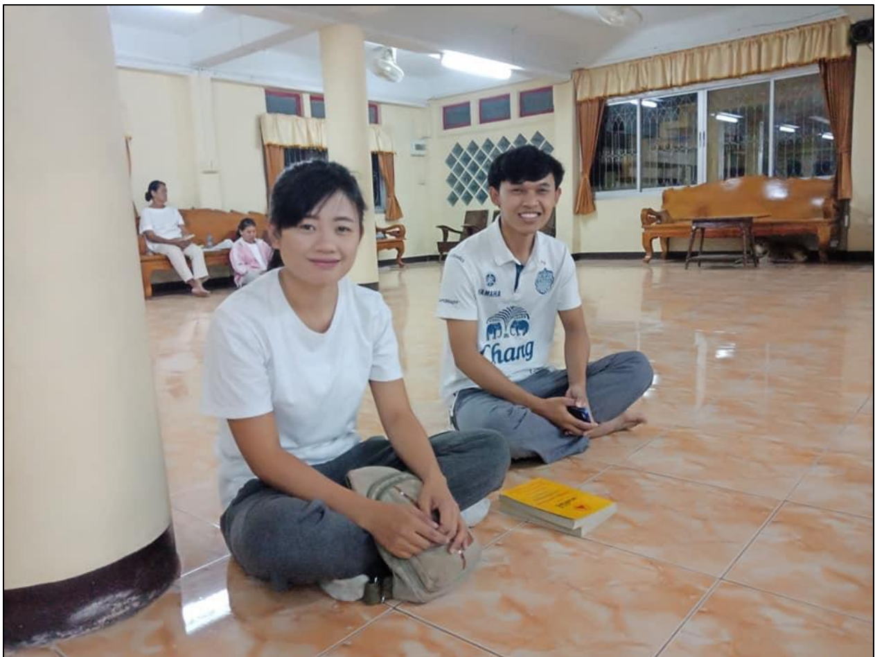
รูปที่ ๔ สวดมนต์เย็นฟังธรรมวันเข้าพรรษา ณ วัดหนองคนที

- การปฏิบัติตนตามหลักศาสนาที่นับถืออย่างเคร่งครัด