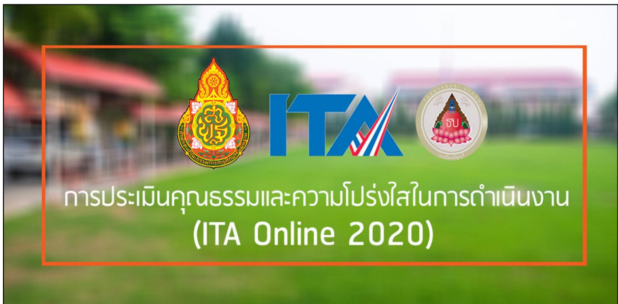
รูปที่ ๑๙ ดำเนินการตามคำสั่งที่ได้รับมอบหมายการประเมินคุณธรรมและความโปร่งใส ในการดำเนินงานของสถานศึกษา (Integrity and Transparency Assessment : ITA) ประจำปีงบประมาณ ๒๕๖๓