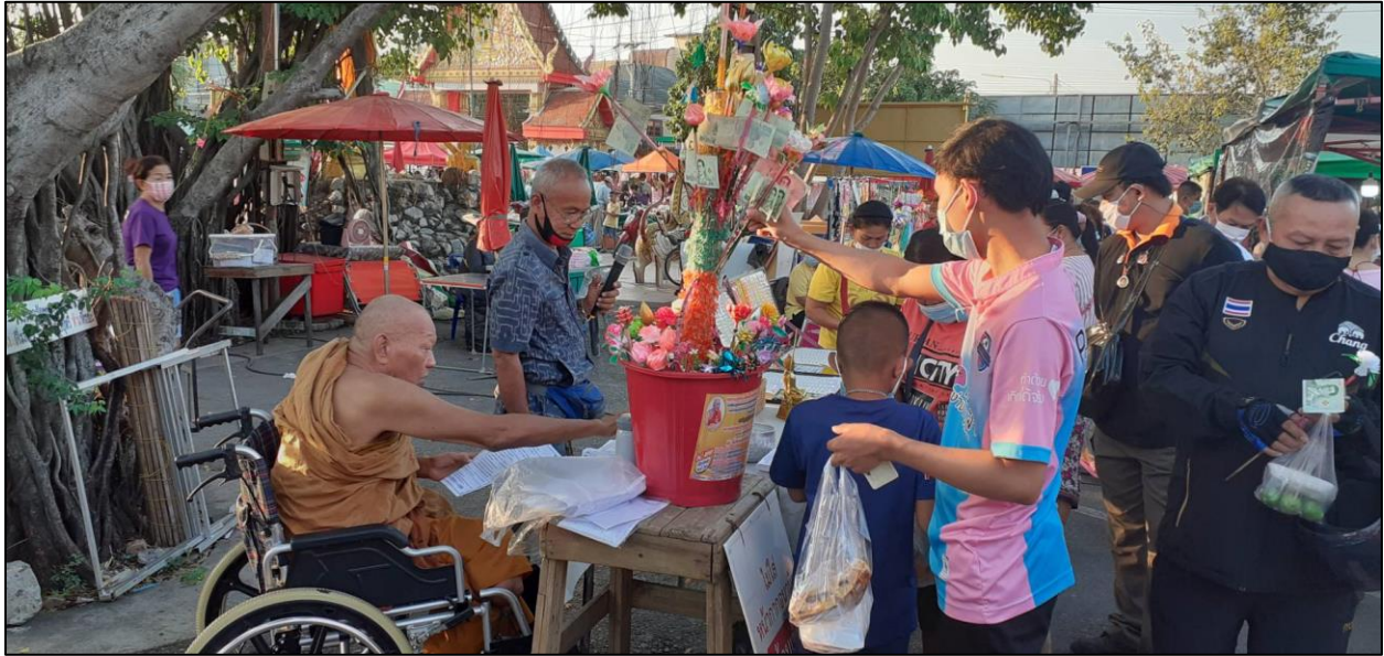
รูปที่ ๖ ร่วมบริจาคร่วมบุญกุศลในสามัคคีกับชุมชนวัดคลองหนึ่ง