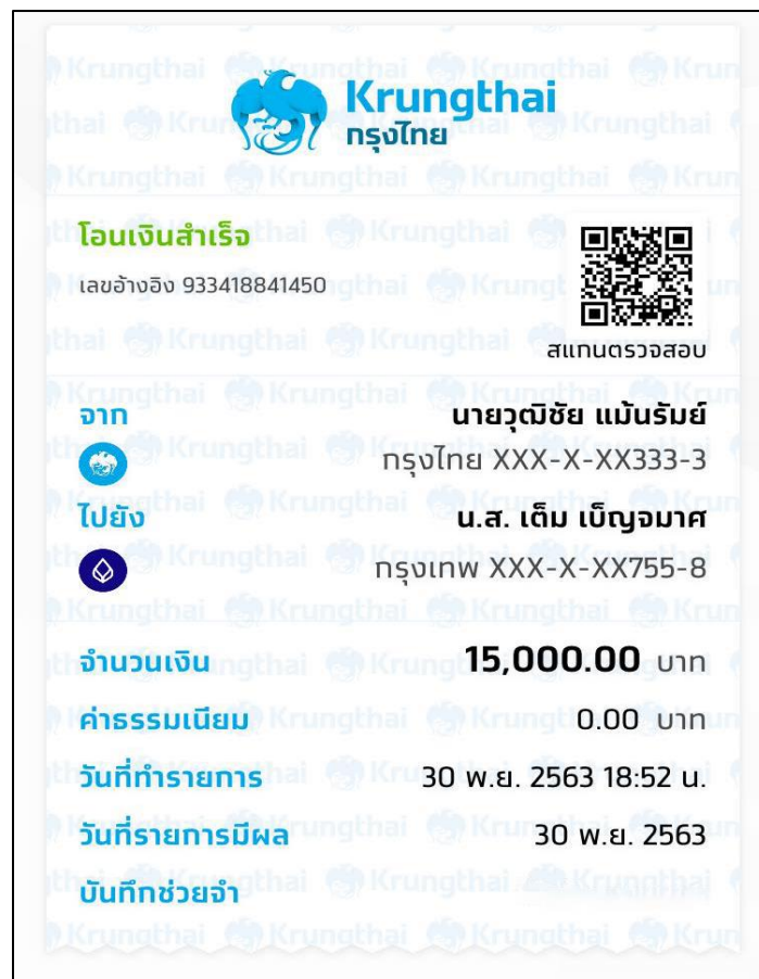
รูปที่ ๑ ส่งเงินให้ผู้ปกครองเป็นประจำทุกเดือน

- การปฏิบัติตนตามหลักศาสนาที่นับถืออย่างเคร่งครัด