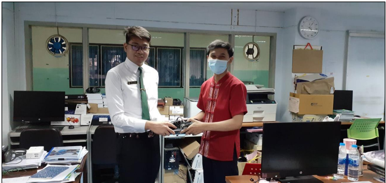
รูปที่ ๑๕ แก้ปัญหาคอมพิวเตอร์เวลาที่มีปัญหาให้กับน้องนักศึกษาฝึกประสบการณ์วิชาชีพ