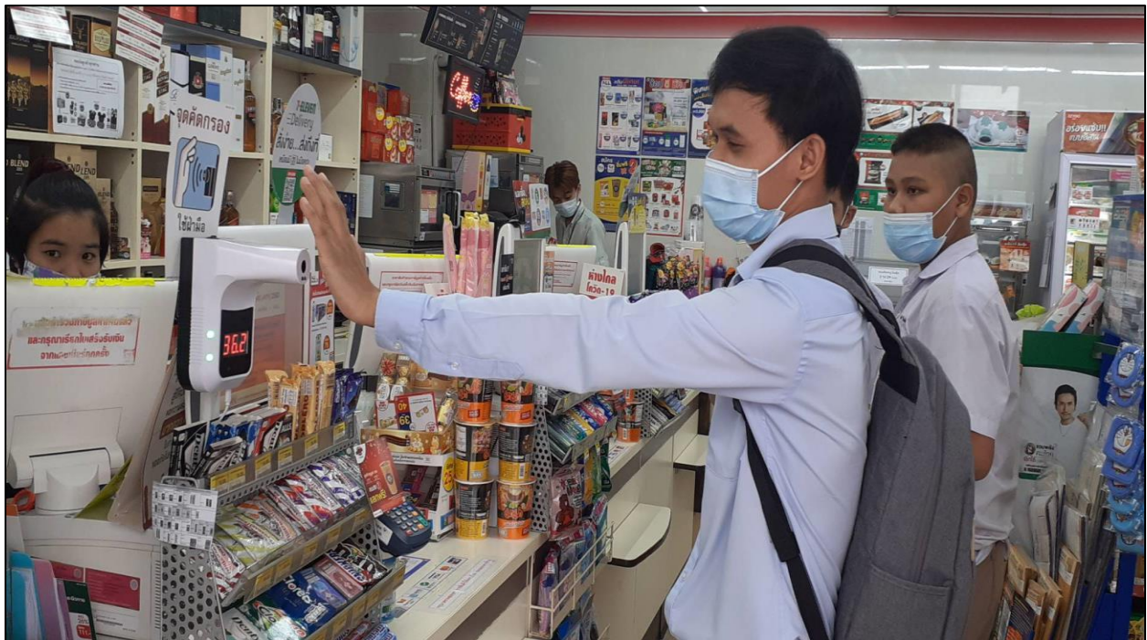
รูปที่ ๗ ตรวจวัดอุณหภูมิก่อนเข้าร้านสะดวกซื้อต่าง ๆ