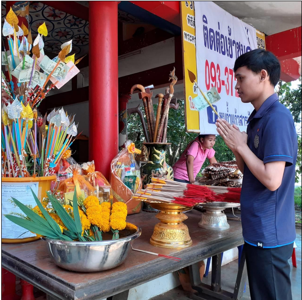
รูปที่ ๕ การร่วมทำบุญเพื่อทำนุบำรุงพระพุทธศาสนา