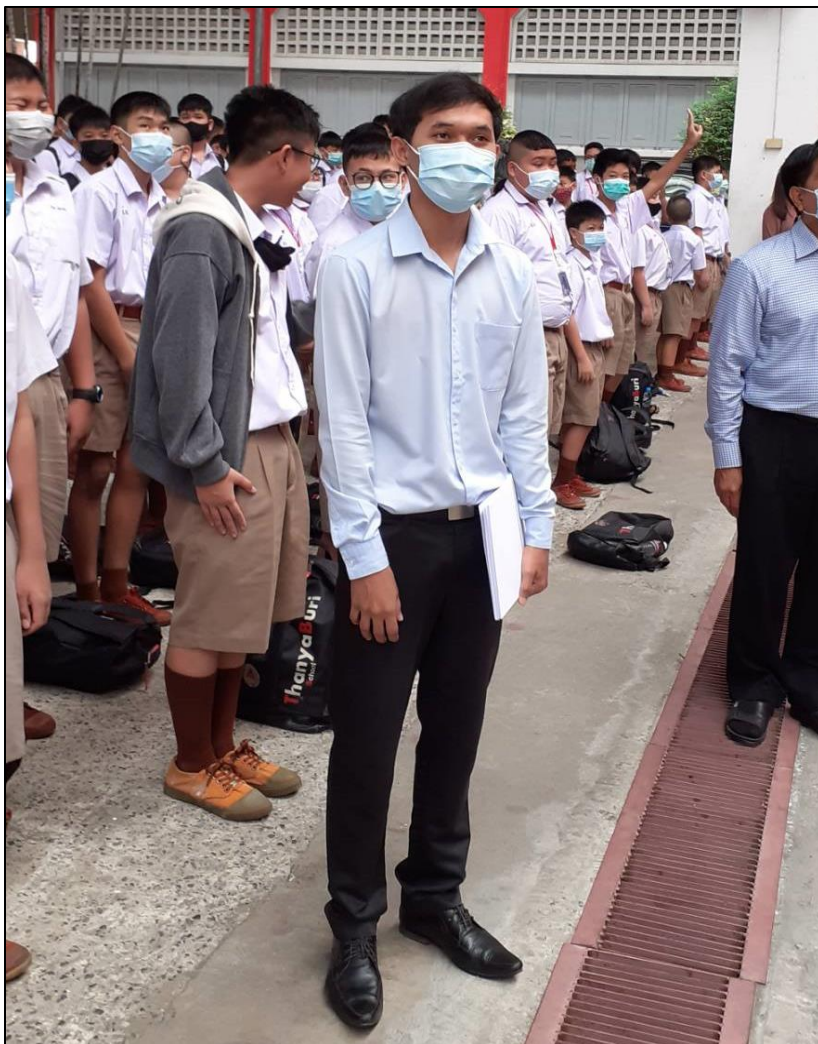
รูปที่ ๙ เคารพธงชาติและพิธีกรรมหน้าเสาธงทุกเช้ามิได้ขาดจนเป็นที่ประจักษ์แก่สายตาคณาจารย์และเพื่อนร่วมวิชาชีพ

- การเห็นความสำคัญ เข้าร่วม ส่งเสริม สนับสนุน กิจกรรมที่แสดงถึง จารีตประเพณี วัฒนธรรมของชาติ