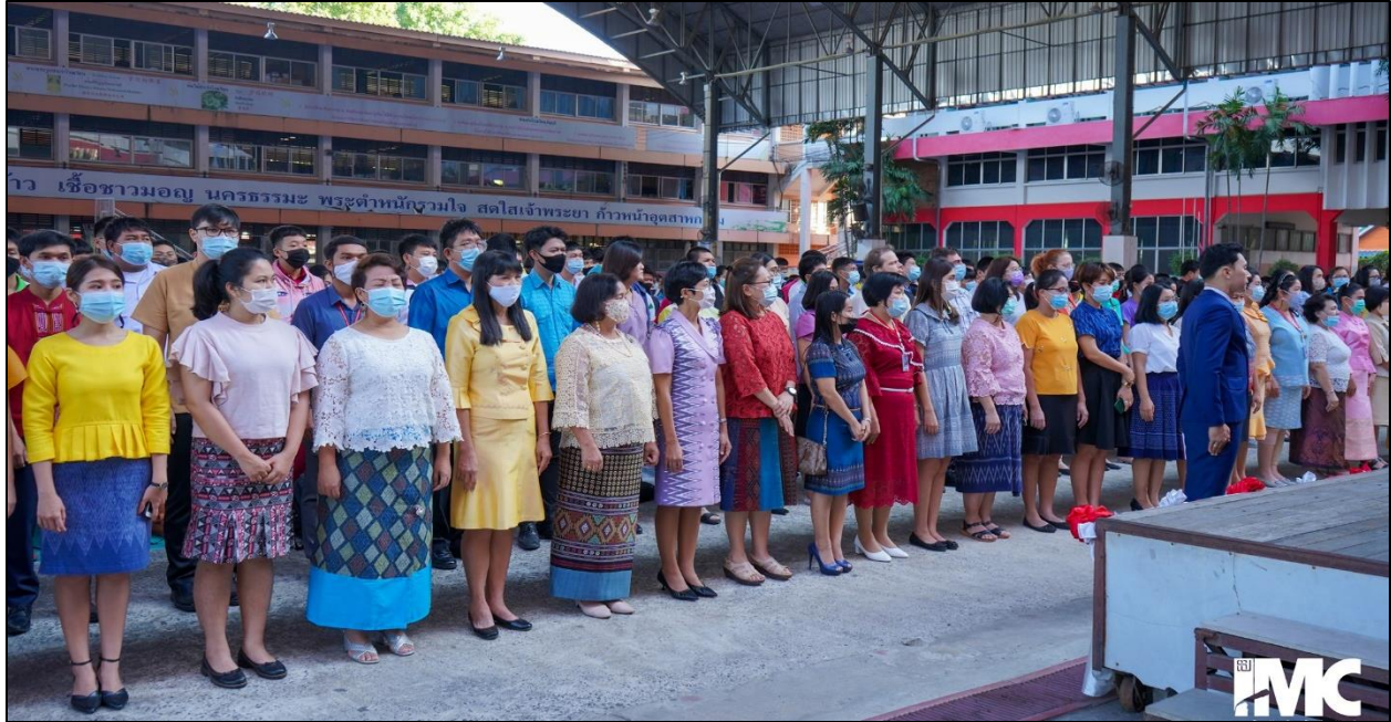
รูปที่ ๑๐ เข้าร่วมกิจกรรมวันชาติ วันที่ ๔ ธันวาคม ๒๕๖๓ ณ ลานกีฬาอเนกประสงค์ โรงเรียนธัญบุรี