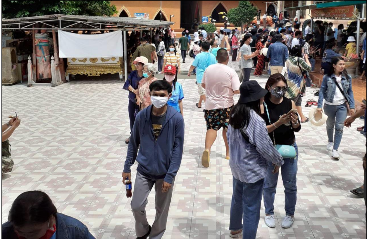
รูปที่ ๘ ตรวจสอบวัดอุณหภูมิก่อนเข้าร้านสะดวกซื้อต่าง ๆ