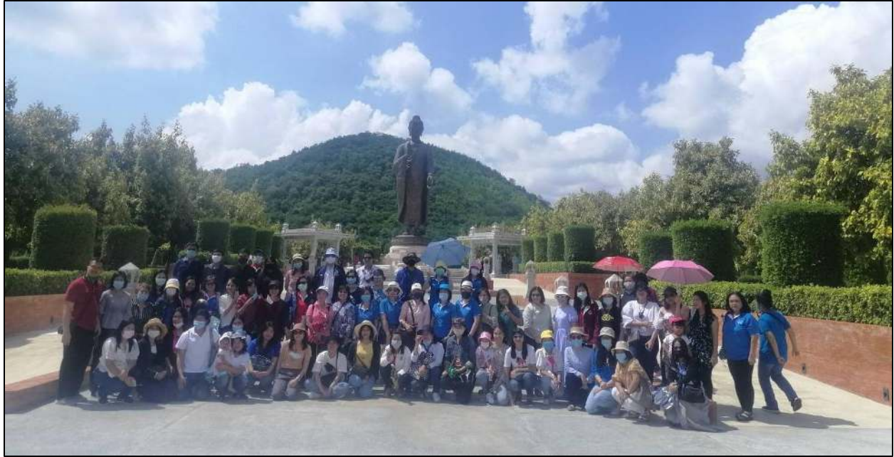
รูปที่ ๒ เข้าร่วมกิจกรรมการศึกษาดูงานร่วมกับคณะครูโรงเรียนธัญบุรี วันที่ ๕ กันยายน ๒๕๖๓ ณ จังหวัดกาญจนบุรี อย่างมีความสุข