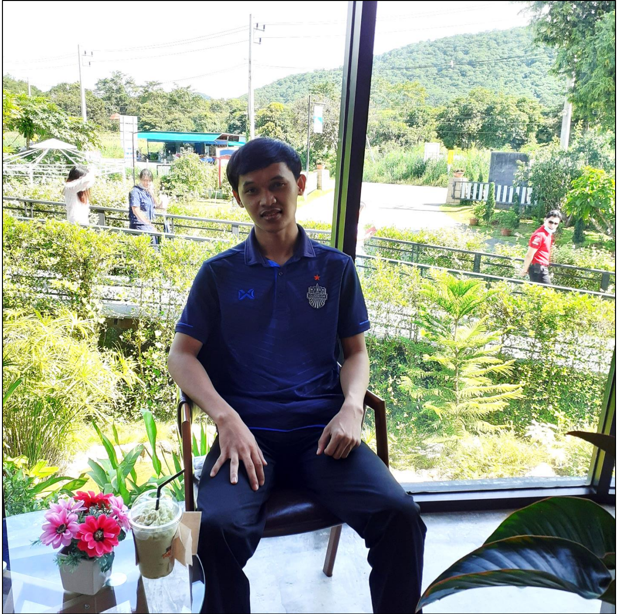
รูปที่ ๘ การแต่งกายในการปฏิบัติงานในเวลาที่อยู่นอกโรงเรียน