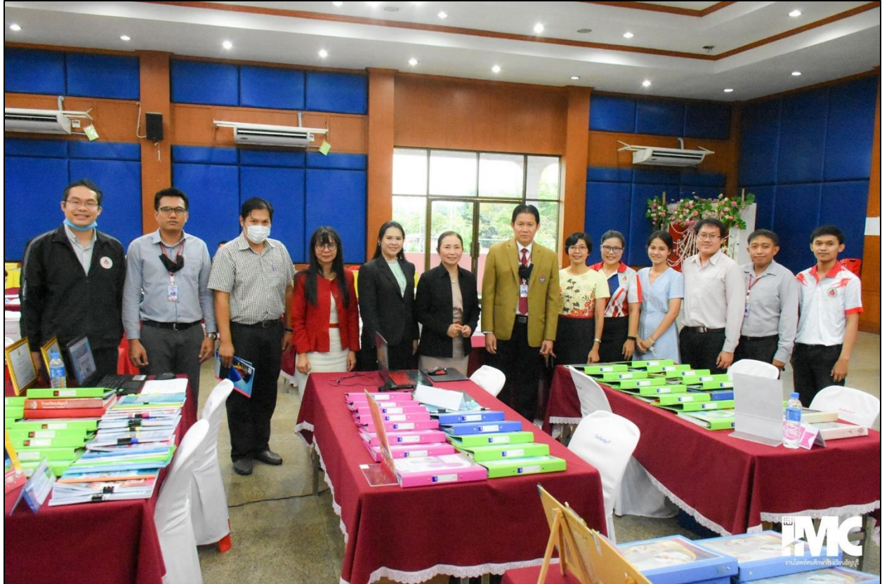
รูปที่ ๔ ร่วมให้กำลังใจครูในกลุ่มงานประเมิน ตรวจสอบและกลั่นกรองข้อมูล ว๒๑ วันที่ ๑๒ พฤศจิกายน ๒๕๖๓ ณ หอประชุมโรงเรียนธัญบุรี