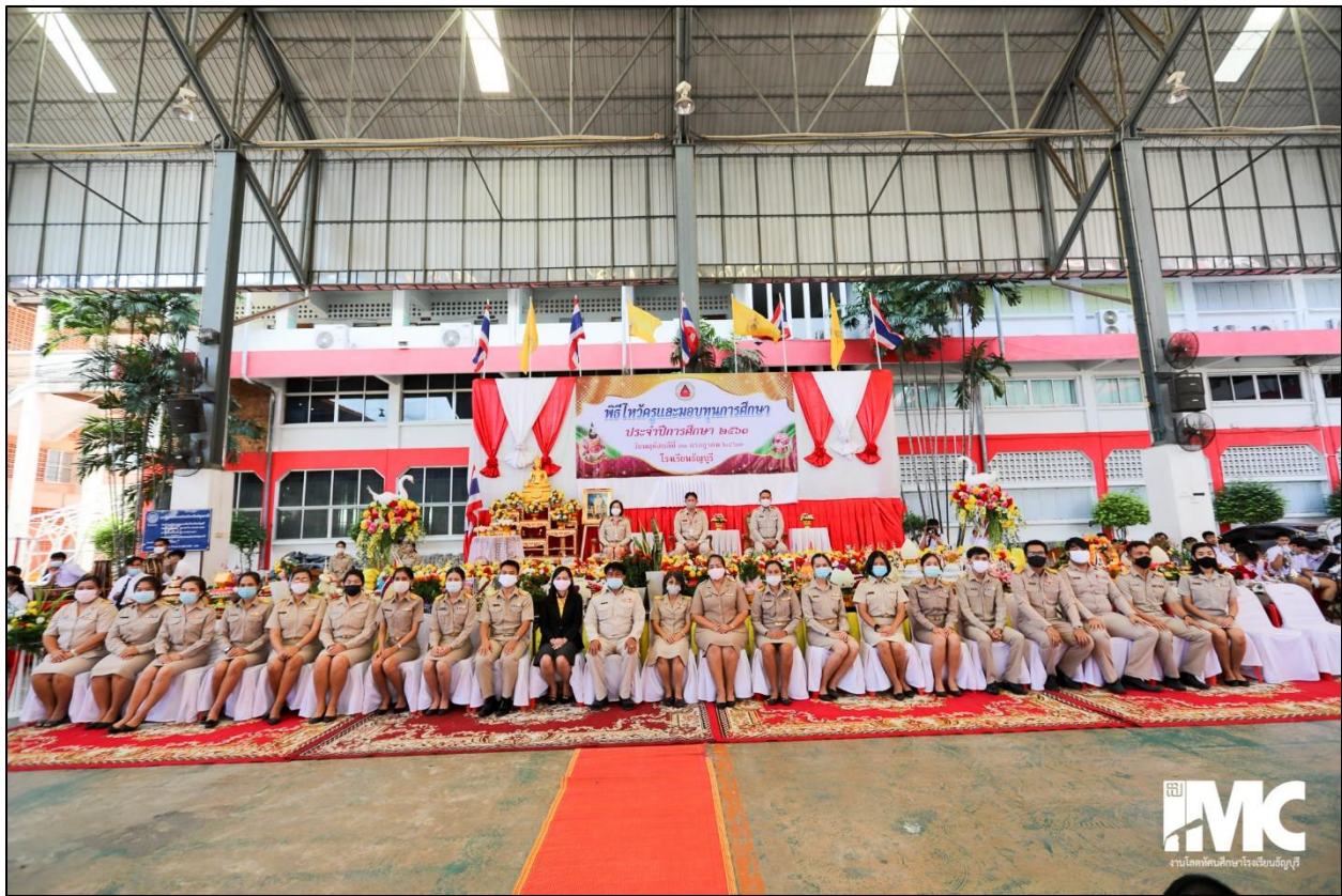
รูปที่ ๙ แต่งชุดกากีที่ถูกระเบียบร่วมถ่ายรูปร่วมกับเพื่อนร่วมวิชาชีพ

- การปกป้อง ป้องกันมิให้ผู้ร่วมวิชาชีพประพฤติปฏิบัติในทางที่จะเกิดภาพลักษณ์เชิงลบต่อวิชาชีพ