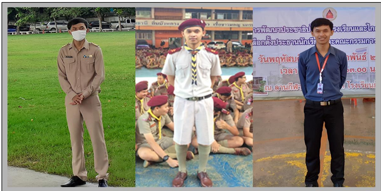
รูปที่ ๗ การแต่งกายในการปฏิบัติงานในเวลาราชการถูกระเบียบ

- ประพฤติปฏิบัติตนในการรักษาภาพลักษณ์ในวิชาชีพ