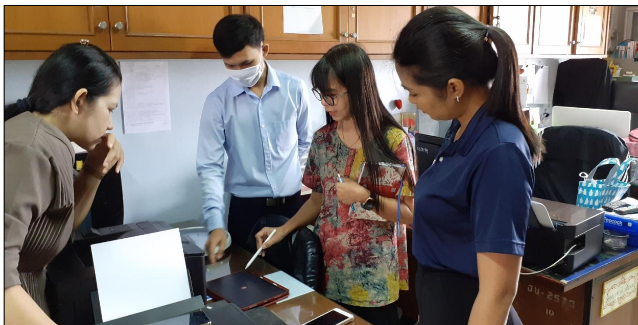
รูปที่ ๑๐ ถ่ายทอดความรู้ด้านเทคโนโลยีสมัยใหม่ที่ใช้ในการจัดการเรียนการสอนในยุคปัจจุบัน ให้แก่ครูที่มีความสนใจ

- การจัดกิจกรรมส่งเสริมการใฝ่รู้ ค้นหาสร้างสรรค์ ถ่ายทอดปลูกฝังและเป็นแบบอย่างที่ดีของเพื่อนร่วมงานและสังคม