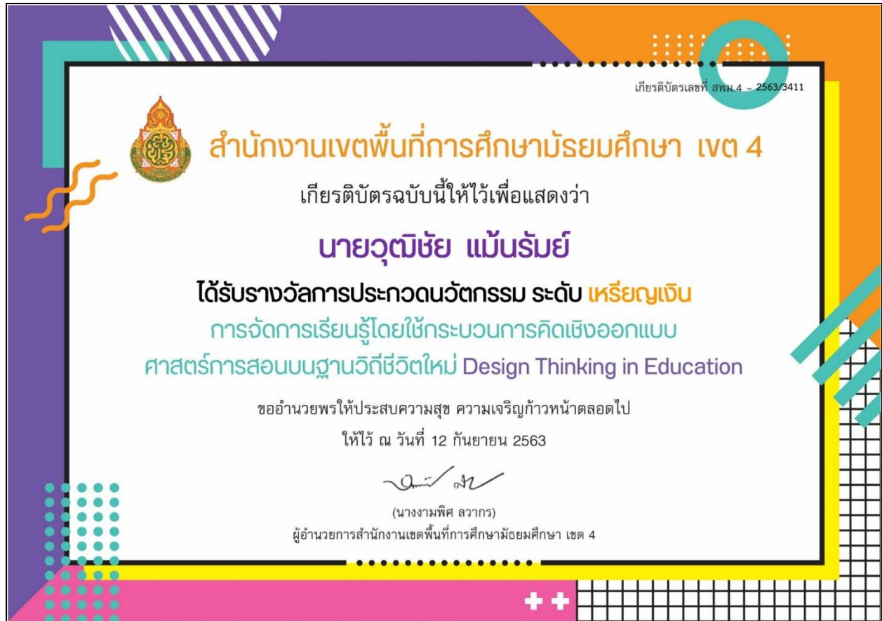
รูปที่ ๖ ได้รับรางวัลการออกแบบศาสตร์การสอน design thinking รูปแบบการจัดการเรียนรู้บนฐานวิถีชีวิตใหม่