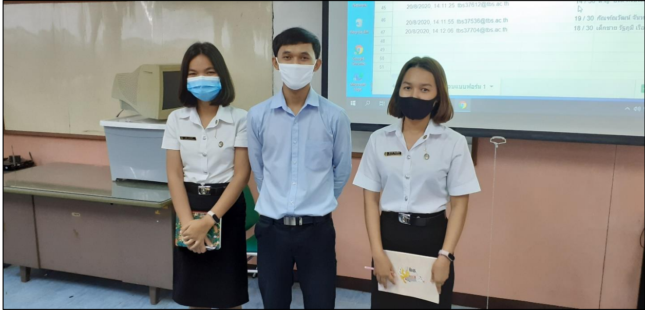
รูปที่ ๑๑ ถ่ายทอดปลุกฝังการเป็นแบบอย่างครูที่ดีแก่นักศึกษาที่มาสังเกตการสอน