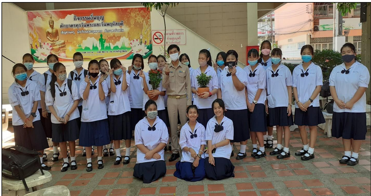
รูปที่ ๑ มีความสุขทุกครั้งที่ได้ร่วมกิจกรรมกับนักเรียน