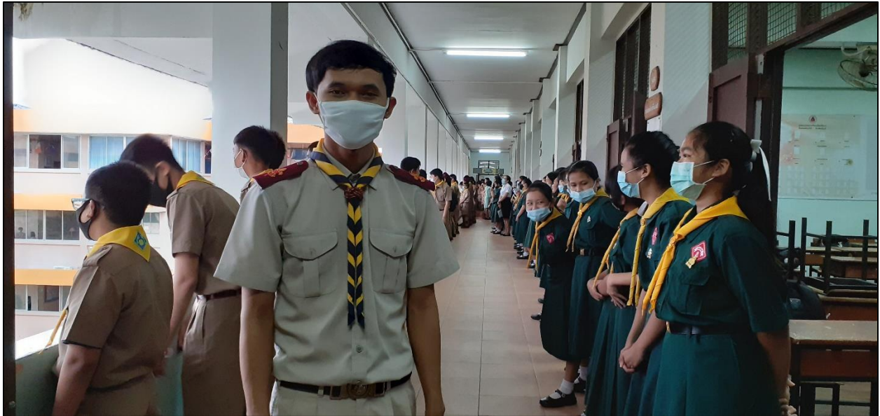
รูปที่ ๑๗ ร่วมกิจกรรมในตอนเช้าทุกครั้งทั้งบริเวณหน้าเสาธง และหน้าชั้นเรียนเพื่อตรวจเช็คจำนวนนักเรียน และสอบถามปัญหาต่าง ๆ