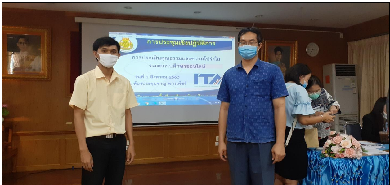
รูปที่ ๒๘ ปฏิบัติหน้าที่รวบรวมข้อมูลประเมินคุณธรรมและความโปร่งใสของสถานศึกษาออนไลน์ร่วมกับคุณครู ฝ่ายกิจการนักเรียน