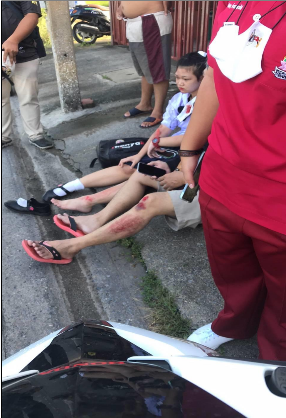
รูปที่ ๑๖ ติดตามอาการนักเรียนที่ประสบอุบัติเหตุรถล้ม ทำเรื่องลา ติดตามงานที่คุณท่านอื่น ๆ สั่ง