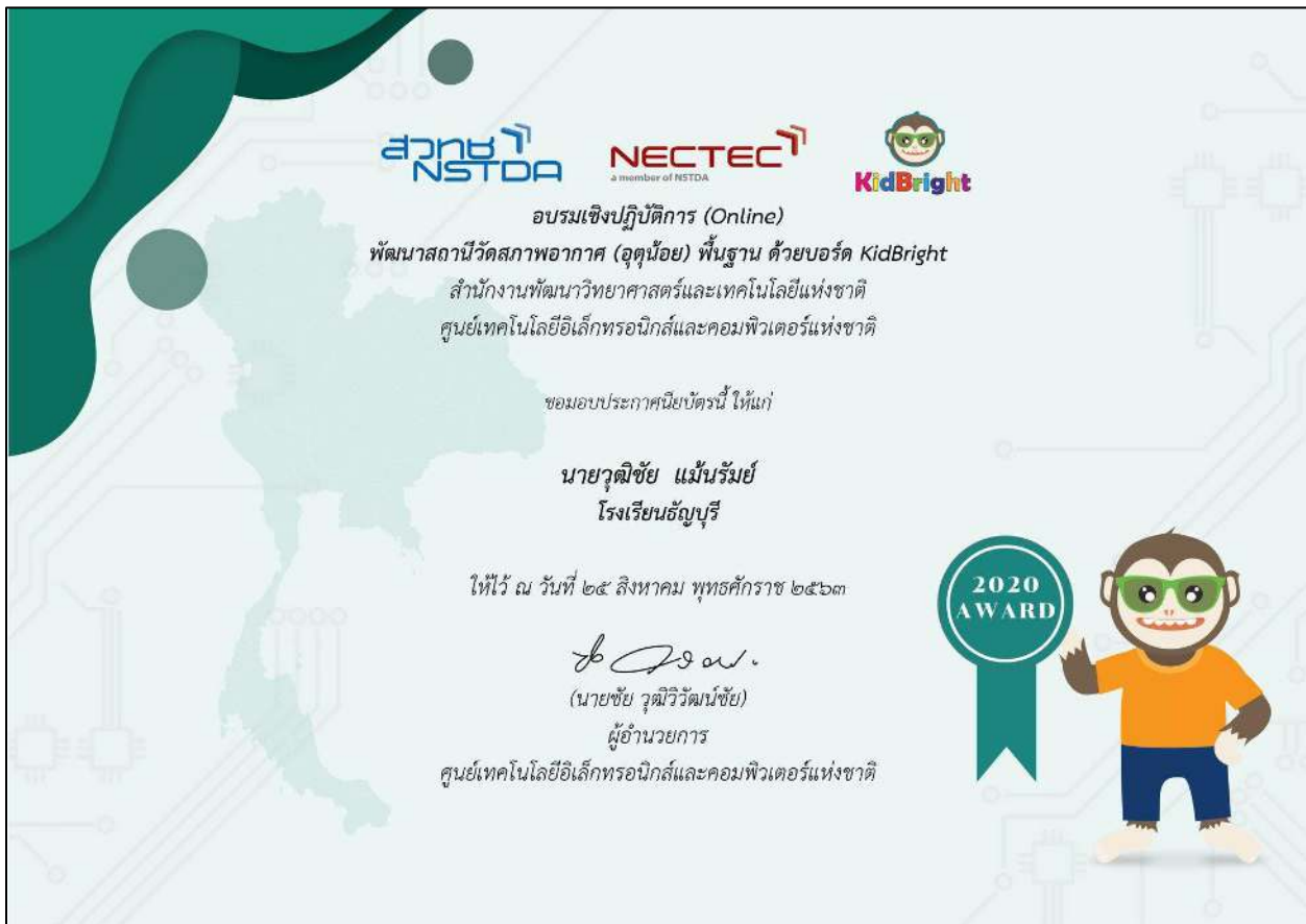
รูปที่ ๓๐ เข้าร่วมโครงการพัฒนาสถานีวิัดสภาพอากาศ (อุตุฯน้อย) ด้วยการใช้บอร์ดสมองกลฝังตัว (kidbright)

- การใช้ความรู้ความสามารถที่มีอยู่ทำให้เกิดความเปลี่ยนแปลงในทางพัฒนาให้กับผู้เรียน โรงเรียนหรือชุมชนในด้านใดด้านหนึ่ง