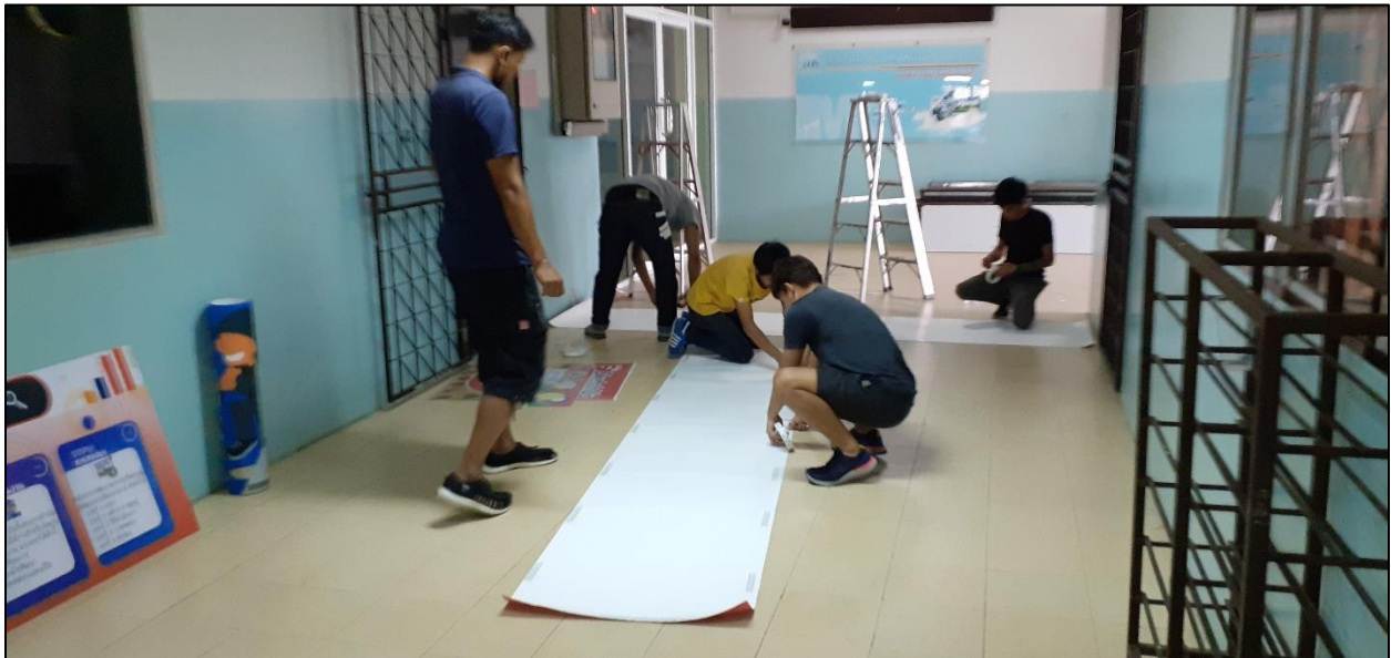
รูปที่ ๘ มาปฏิบัติงานในวันหยุด โดยไม่หวังสิ่งตอบแทน