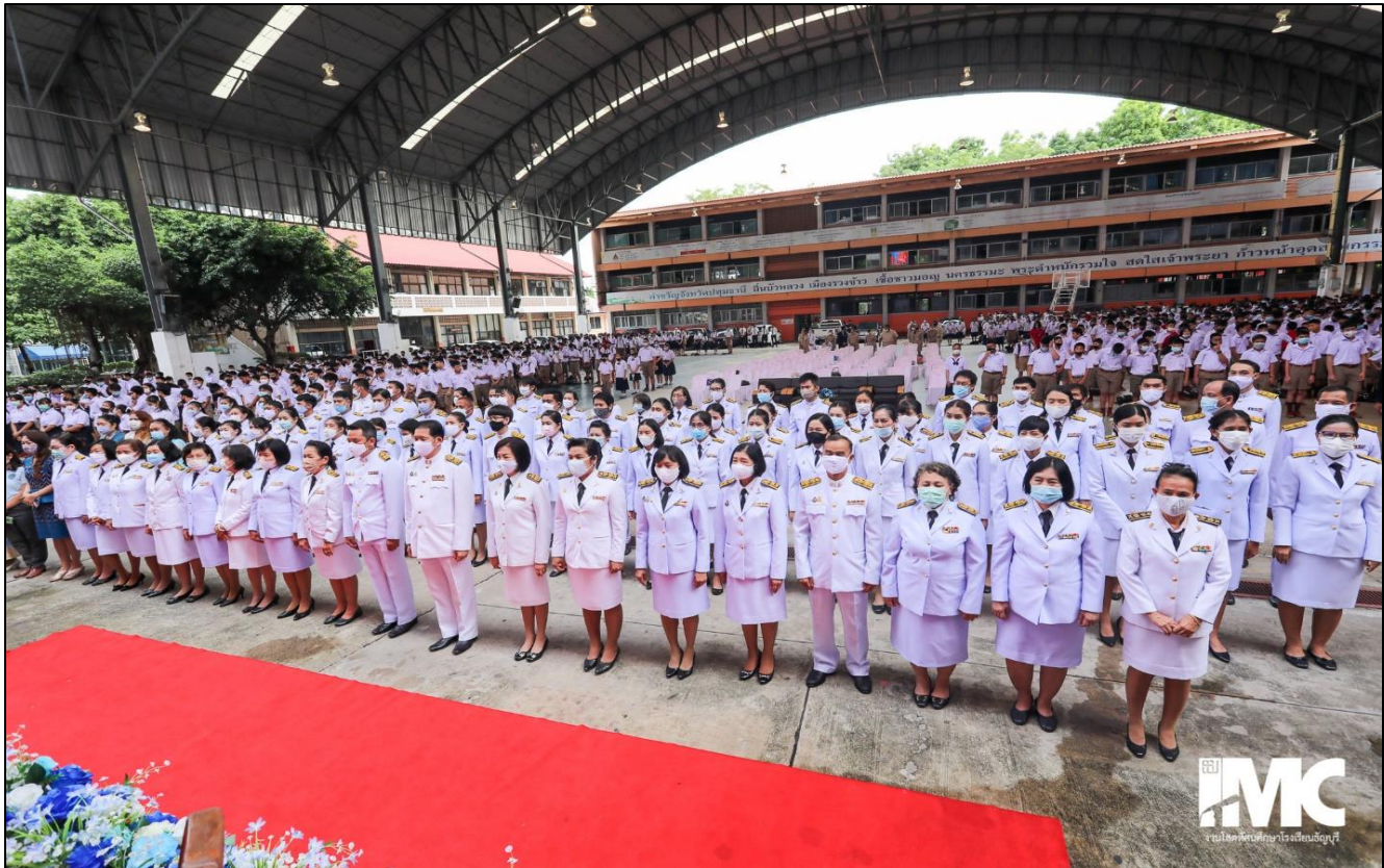
รูปที่ ๒๑ เข้าร่วมทุกกิจกรรมของโรงเรียน ปฏิบัติตามระเบียบและแนวปฏิบัติที่ได้รับแจ้งจากทางโรงเรียน