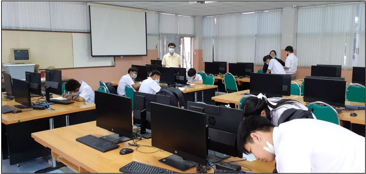
รูปที่ ๑๙ ดูแลนักเรียนในการติดตามงาน แก้ผลการเรียน ๐ ร มส.