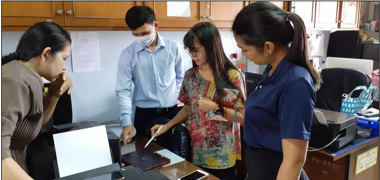
รูปที่ ๗ แนะนำการใช้งานไอแพด ในเวลานอกเวลาราชการ โดยไม่หวังสิ่งตอบแทน