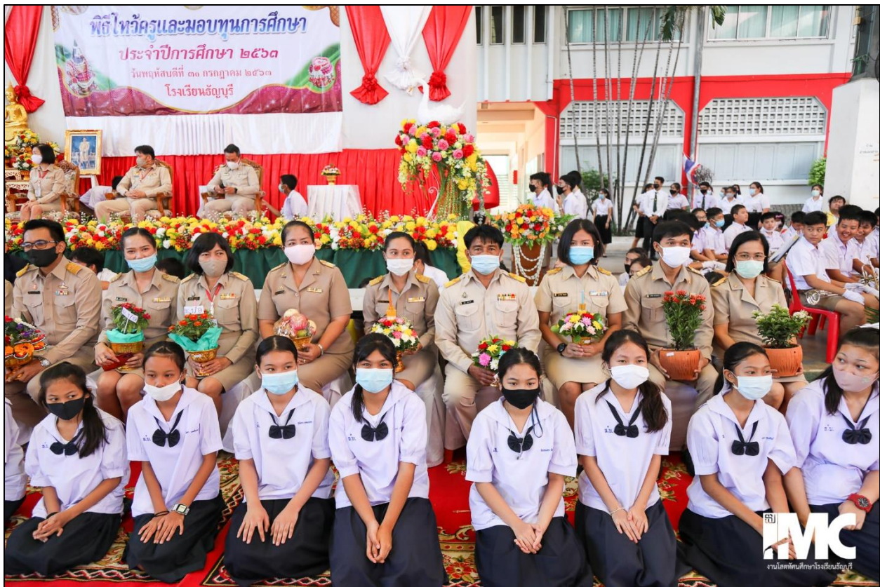
รูปที่ ๑๓ เข้าร่วมกิจกรรมวันไหว้ครู ประจำปีการศึกษา ๒๕๖๓

- การให้ความสำคัญเข้าร่วมส่งเสริม สนับสนุนกิจกรรมที่เกี่ยวข้องกับวิชาชีพครูอย่างสม่ำเสมอ