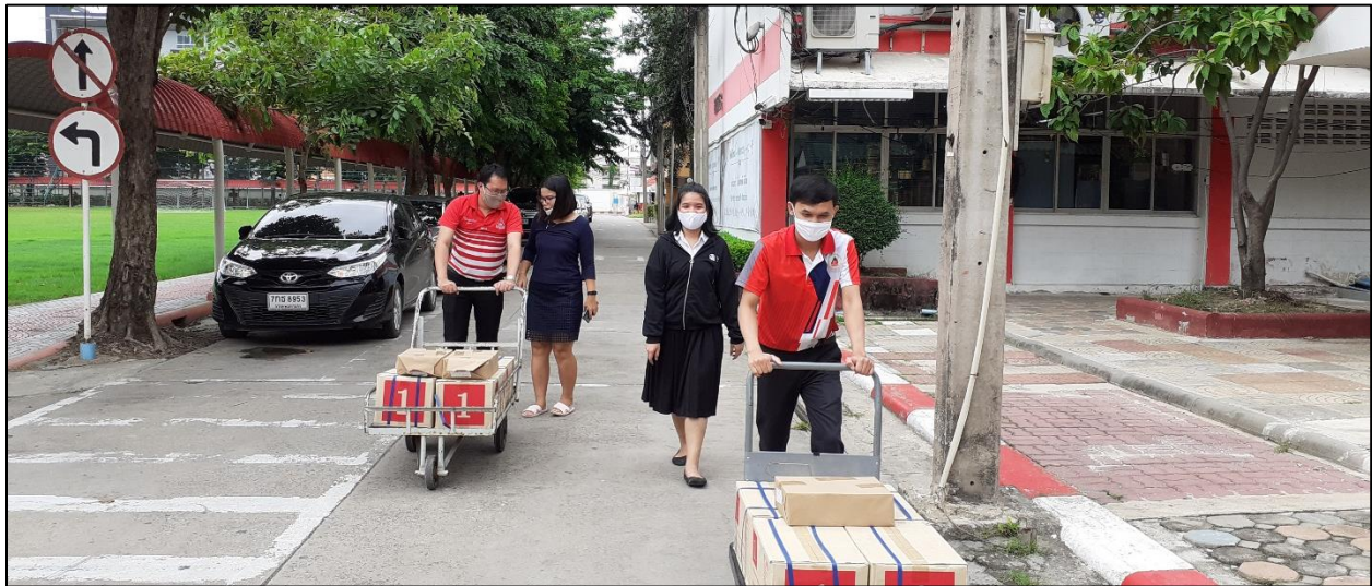
รูปที่ ๒๕ ร่วมกันเคลื่อนย้ายหนังสือเรียน เพื่อแจกนักเรียนที่เรียนในรายวิชาคอมพิวเตอร์

- การทำงานกับผู้อื่นโดยยึดหลักความสามัคคี เกื้อกูลซึ่งกันและกัน