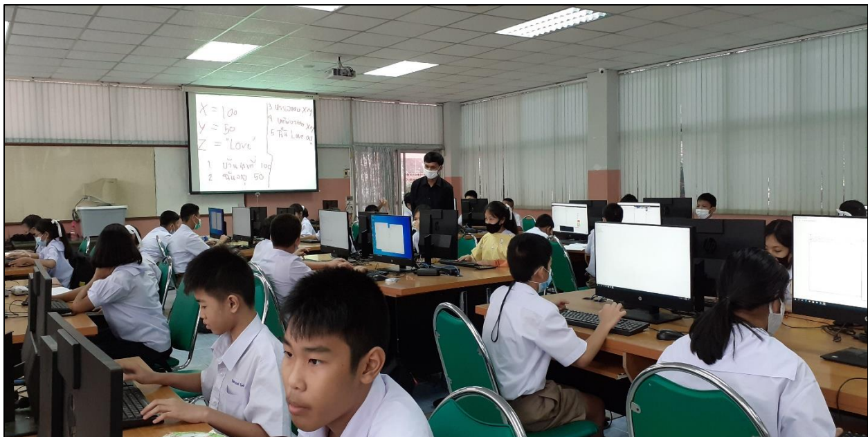
รูปที่ ๒๓ คอยช่วยเหลือนักเรียนที่เรียนไม่ทันเพื่อน

- การไม่ปฏิบัติตนที่ส่งผลต่อเชิงลบต่อกายและจิตใจของผู้เรียน