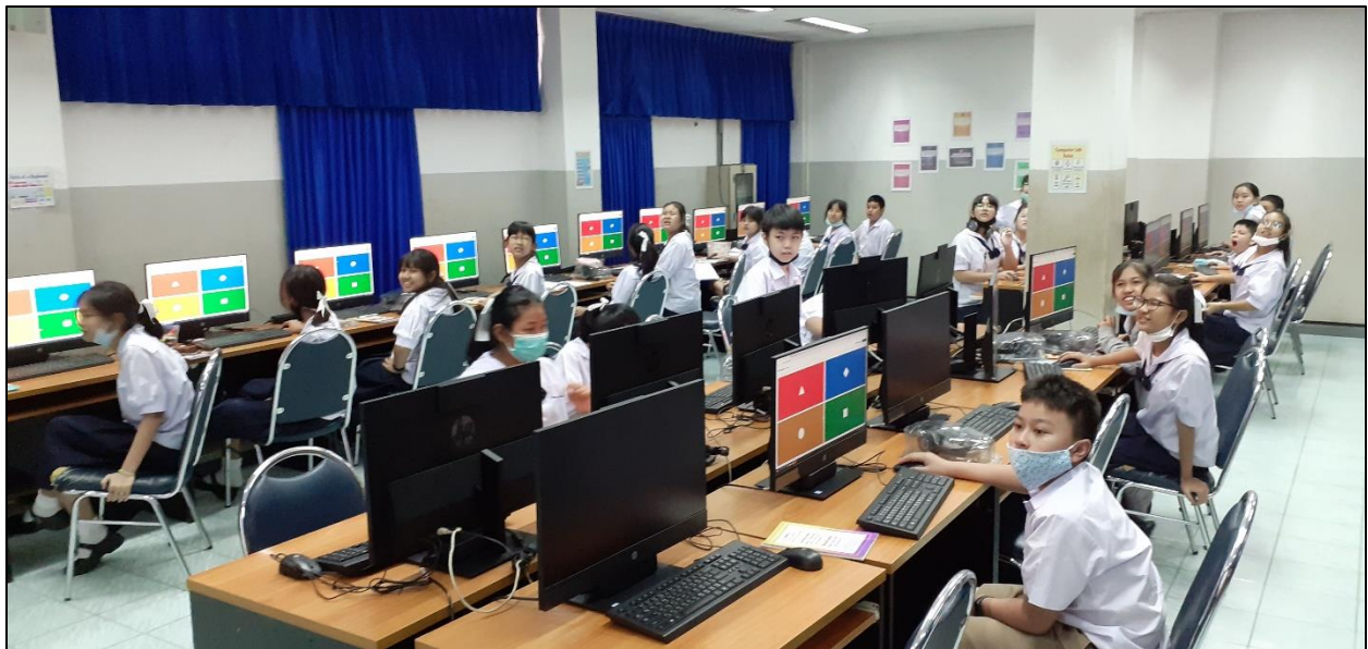
รูปที่ ๑๑ เลือกทำกิจกรรมที่นักเรียนทุกคนมีส่วนร่วมในการเรียนรู้ เช่นการเล่นเกมส์ Kahoot เป็นกิจกรรมนำเข้าสู่บทเรียน