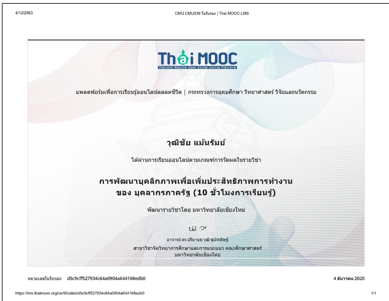
รูปที่ ๑ ได้ผ่านการเรียนออนไลน์ตามเกณฑ์วัดผลในรายวิชาการพัฒนาคุณภาพเพื่อเพิ่มประสิทธิภาพการทำงานของบุคลากรภาครัฐ (๑๐ ชั่วโมงการเรียนรู้)

- การพัฒนาวิชาชีพและบุคลิกภาพอย่างต่อเนื่อง