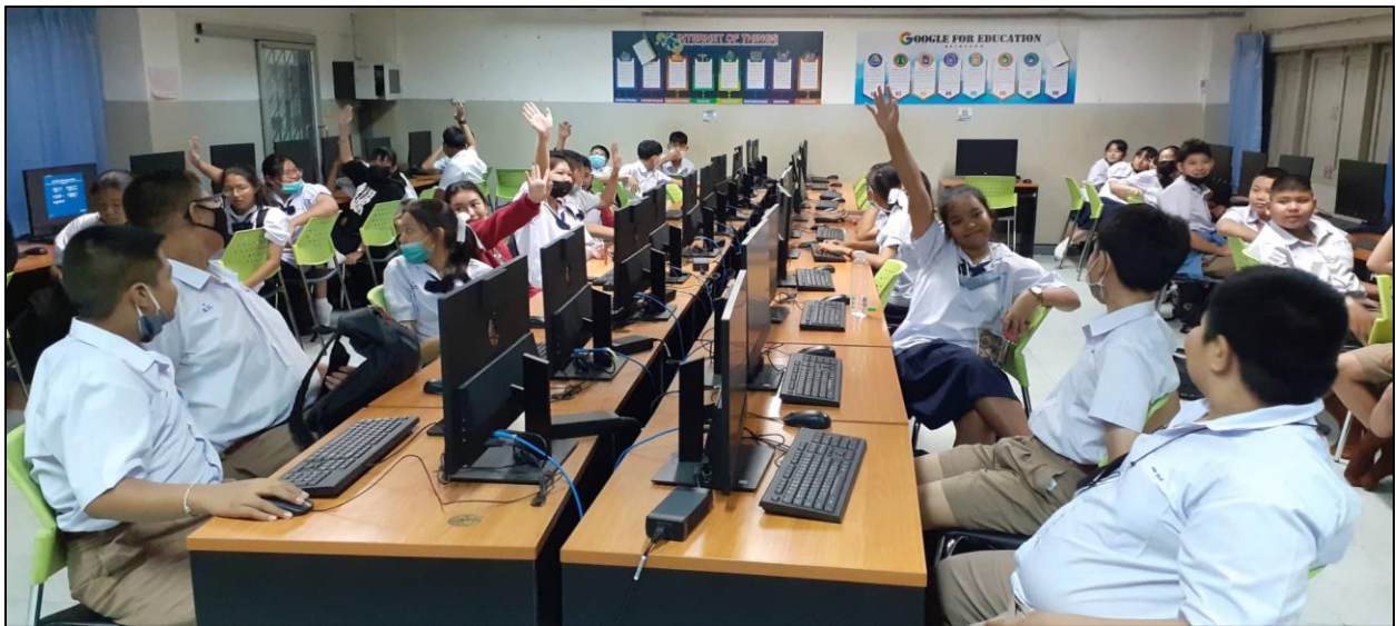
รูปที่ ๙ นักเรียนมีส่วนร่วมในการเลือกทำกิจกรรมที่นักเรียนสนใจ

- การมุ่งมั่นต่อการพัฒนาความรู้ความสามารถของผู้เรียน