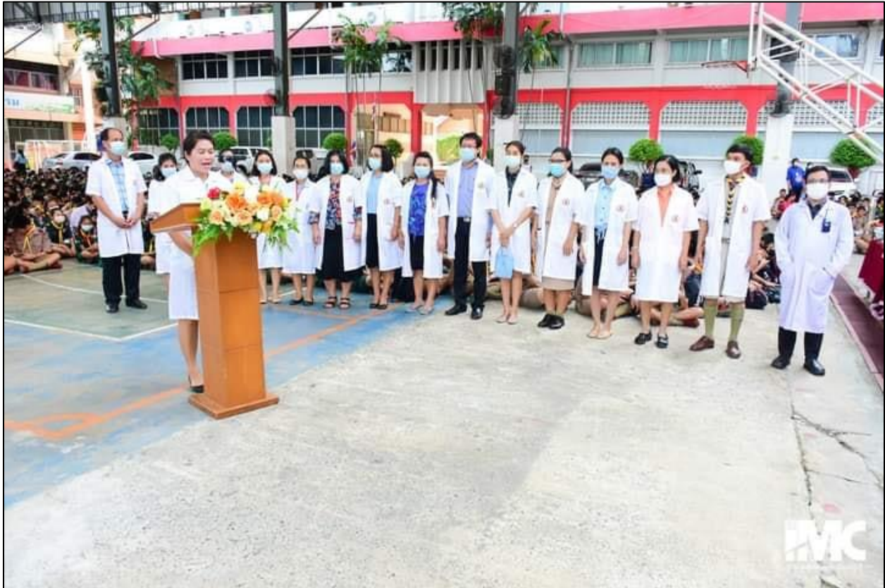
รูปที่ ๒๙ ร่วมกิจกรรมวันวิทยาศาสตร์ วันวันที่ ๑๘ สิงหาคม ๒๕๖๓ โดยได้รับหน้าที่ในการสร้างแบบทดสอบออนไลน์และระบบส่งใบเกียรติบัตรออนไลน์