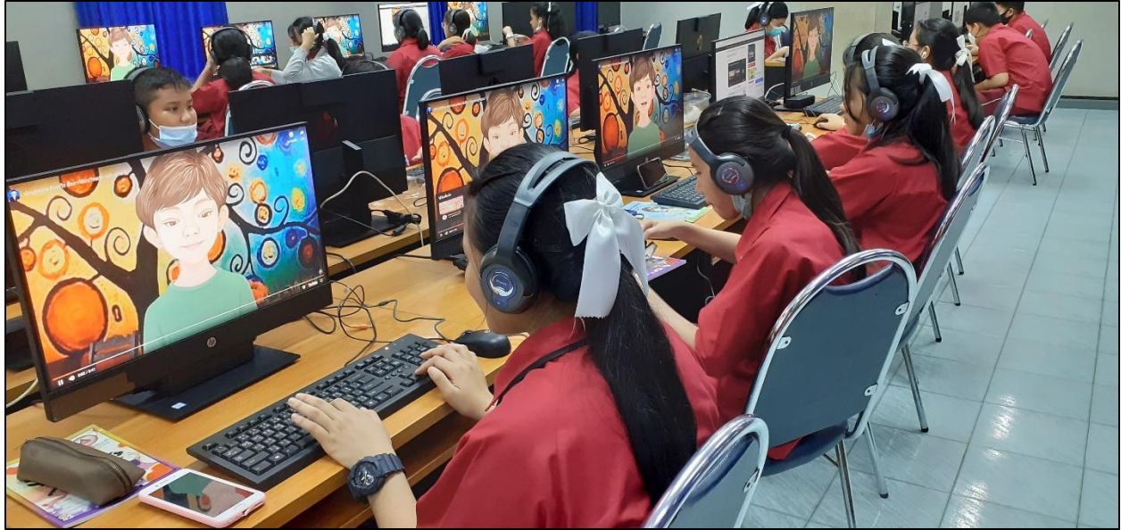
รูปที่ ๑๐ ออกแบบสื่อการสอนให้มีความน่าสนใจ