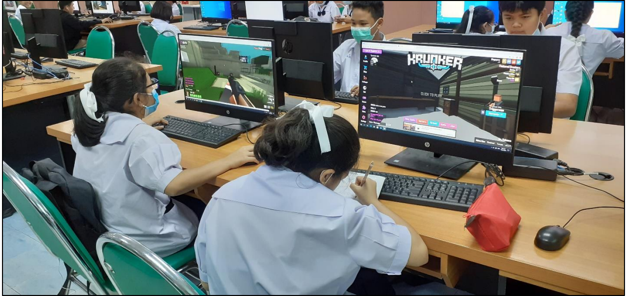
รูปที่ ๒๔ เล่นเกมส์ ดูหนัง ฟังเพลง หรือเอาวิชาอื่นขึ้นมาทำได้ เมื่อทำกิจกรรมต่าง ๆ ภายในห้องเสร็จเรียบร้อยแล้ว