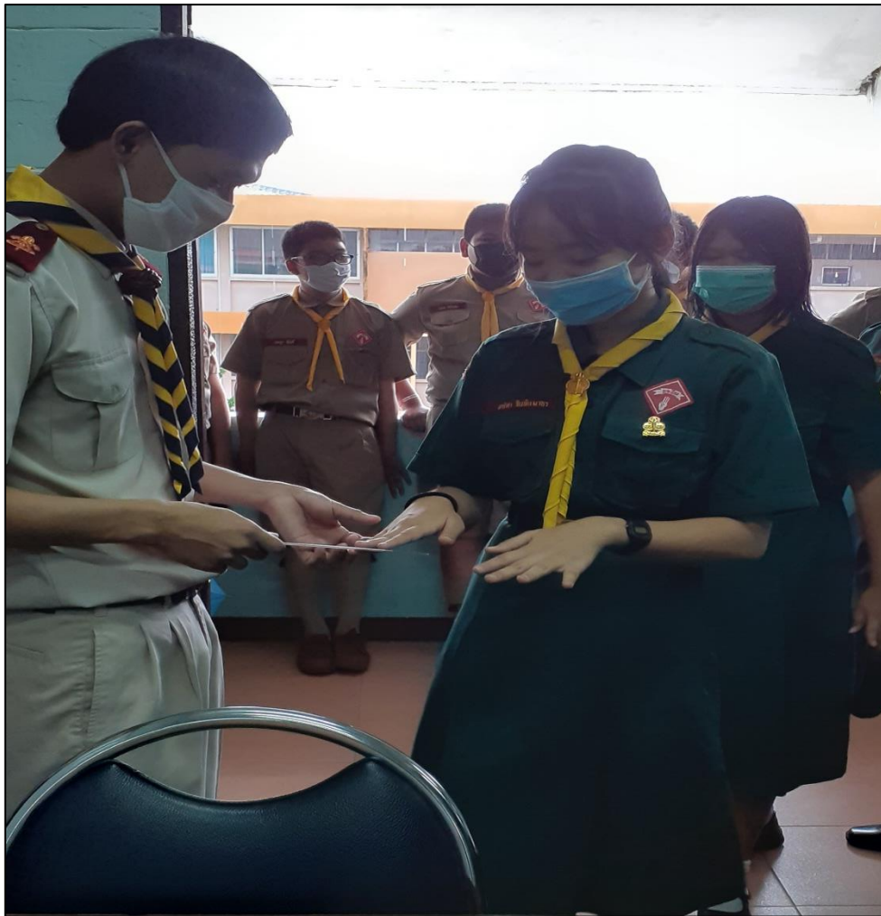
รูปที่ ๑๕ ตรวจสอบความสะอาดเล็บนักเรียนเพื่อป้องกันเชื้อโรคต่าง ๆ

- รัก เมตตา เอาใจใส่ ช่วยเหลือ สนับสนุน ให้บริการผู้เรียนทุกคน ด้วยความเสมอภาค