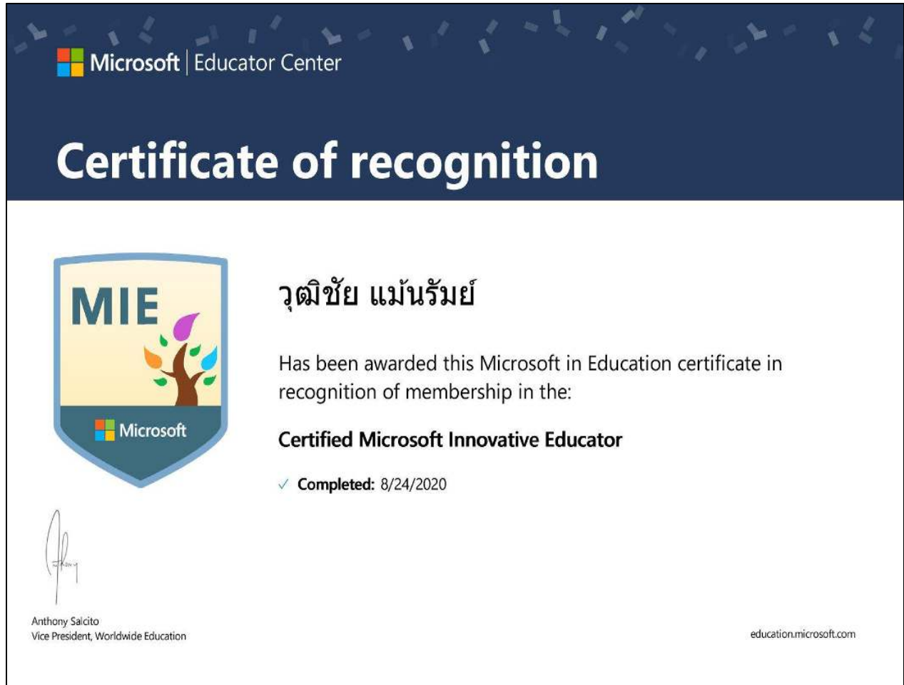
รูปที่ ๒ ผ่านการอบรมหลักสูตรนวัตกรรมทางการศึกษา