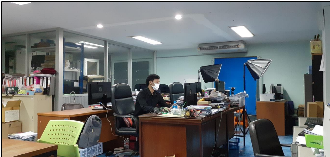
รูปที่ ๕ ติดตามข่าวสารจากเว็บไซต์ออนไลน์ต่าง ๆ