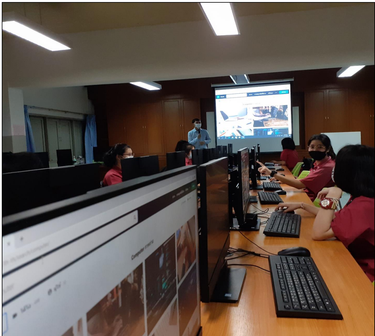
รูปที่ ๖ สอนนักเรียนที่ขาดเรียนบ่อยครั้ง ในเวลาหลังการเลิกเรียน โดยไม่หวังสิ่งตอบแทน

- การไม่อาศัยวิชาชีพแสวงหาผลประโยชน์ที่ไม่ถูกต้อง