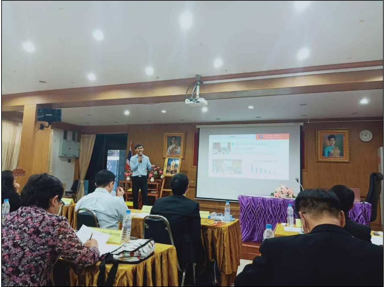
รูปที่ ๔ นำเสนอรูปแบบการจัดการเรียนการสอนบนฐานวิถีชีวิตใหม่ ณ สำนักงานเขตพื้นที่การศึกษามัธยมศึกษา เขต ๔ วันที่ ๑๒ กันยายน ๒๕๖๓