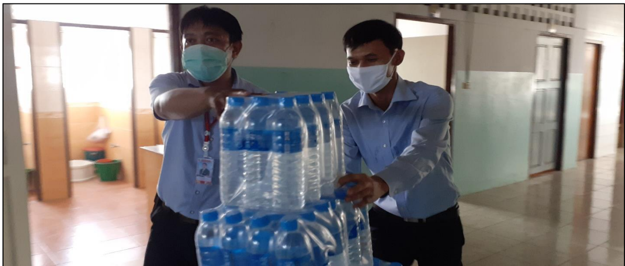
รูปที่ ๒๖ ร่วมกันขนน้ำดื่มที่ทางโรงเรียนแจกให้แก่ครูสำหรับกลุ่มงานคอมพิวเตอร์