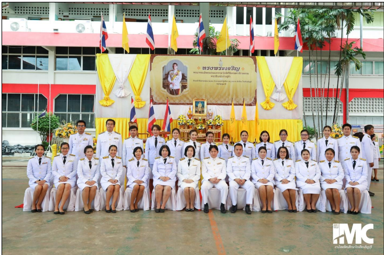
รูปที่ ๓๑ เข้าร่วมกิจกรรมถวายพระพรในหลวงรัชกาลที่ ๑๐ ณ ลานกีฬาเอนกประสงค์โรงเรียนธัญบุรี วันที่ ๒๔ กรกฎาคม ๒๕๖๓

- การยึดมั่นในการปกครองระบบประชาธิปไตยอันมีพระมหากษัตริย์ทรงเป็นประมุข