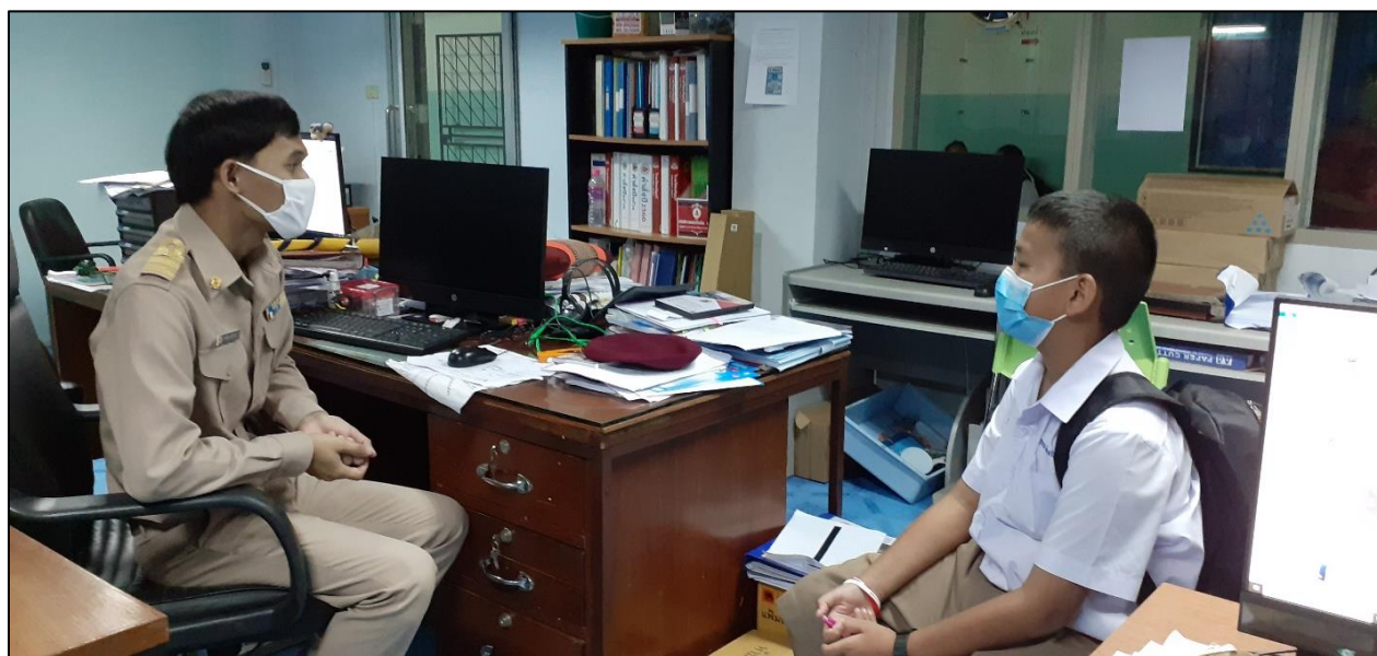
รูปที่ ๑๒ ให้คำปรึกษานักเรียนเรื่องของความรักในวัยเรียน