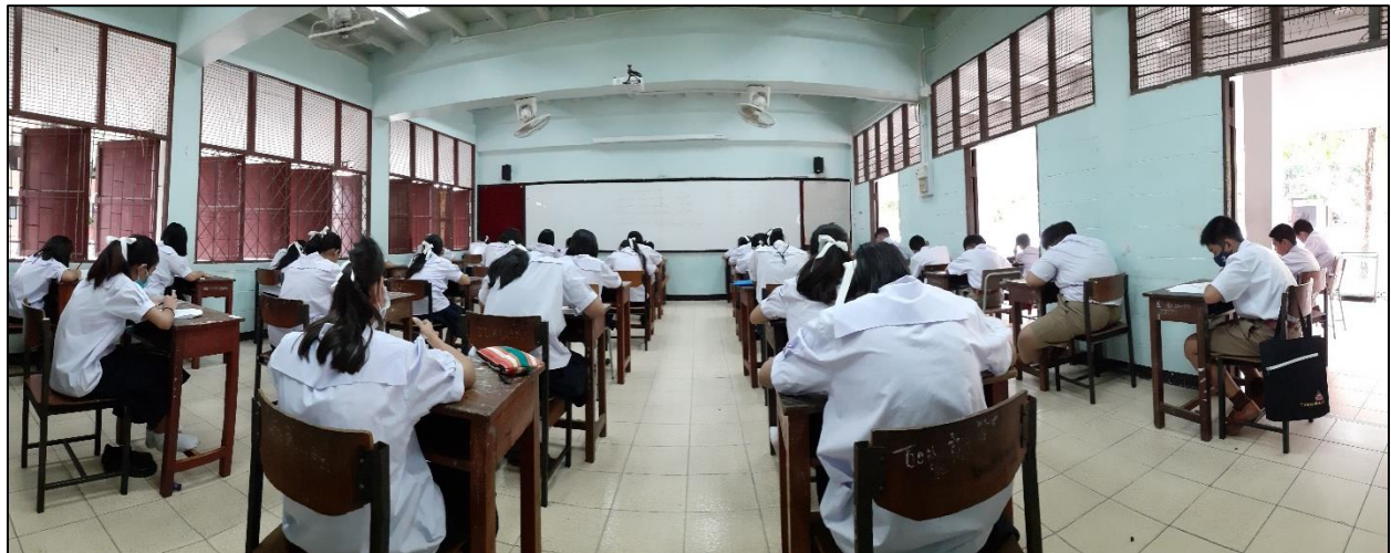
รูปที่ ๓ ความสะอาดของห้องเรียนสำหรับนักเรียนห้องที่ปรึกษา