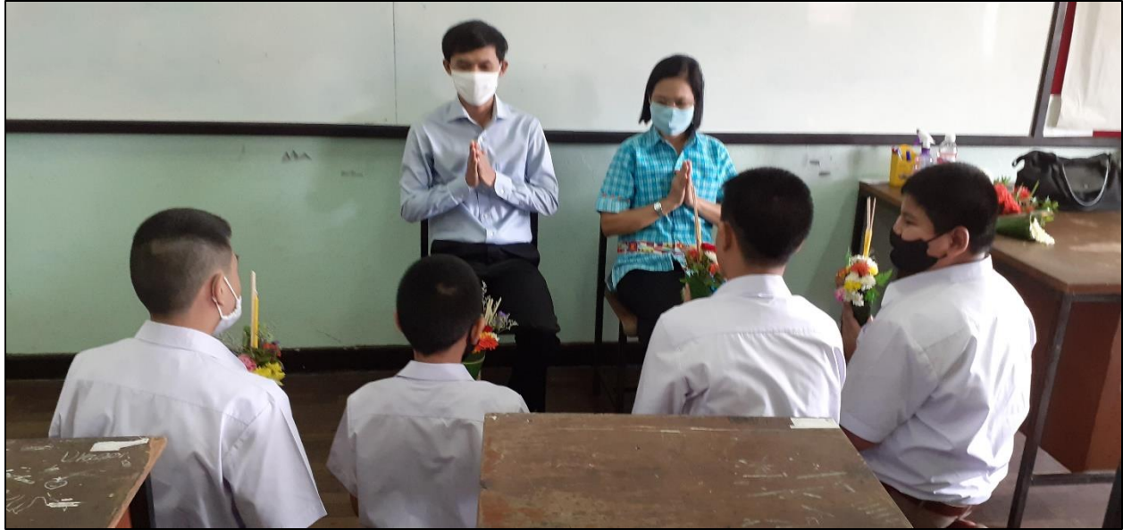
รูปที่ ๑๕ กิจกรรมวันไหว้ครูภายในชั้นเรียน