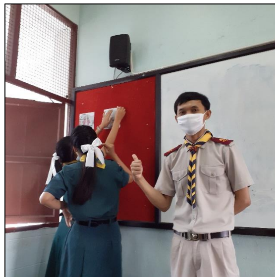
รูปที่ ๗-๘ จัดบอร์ดความรู้ภายในห้องเรียน