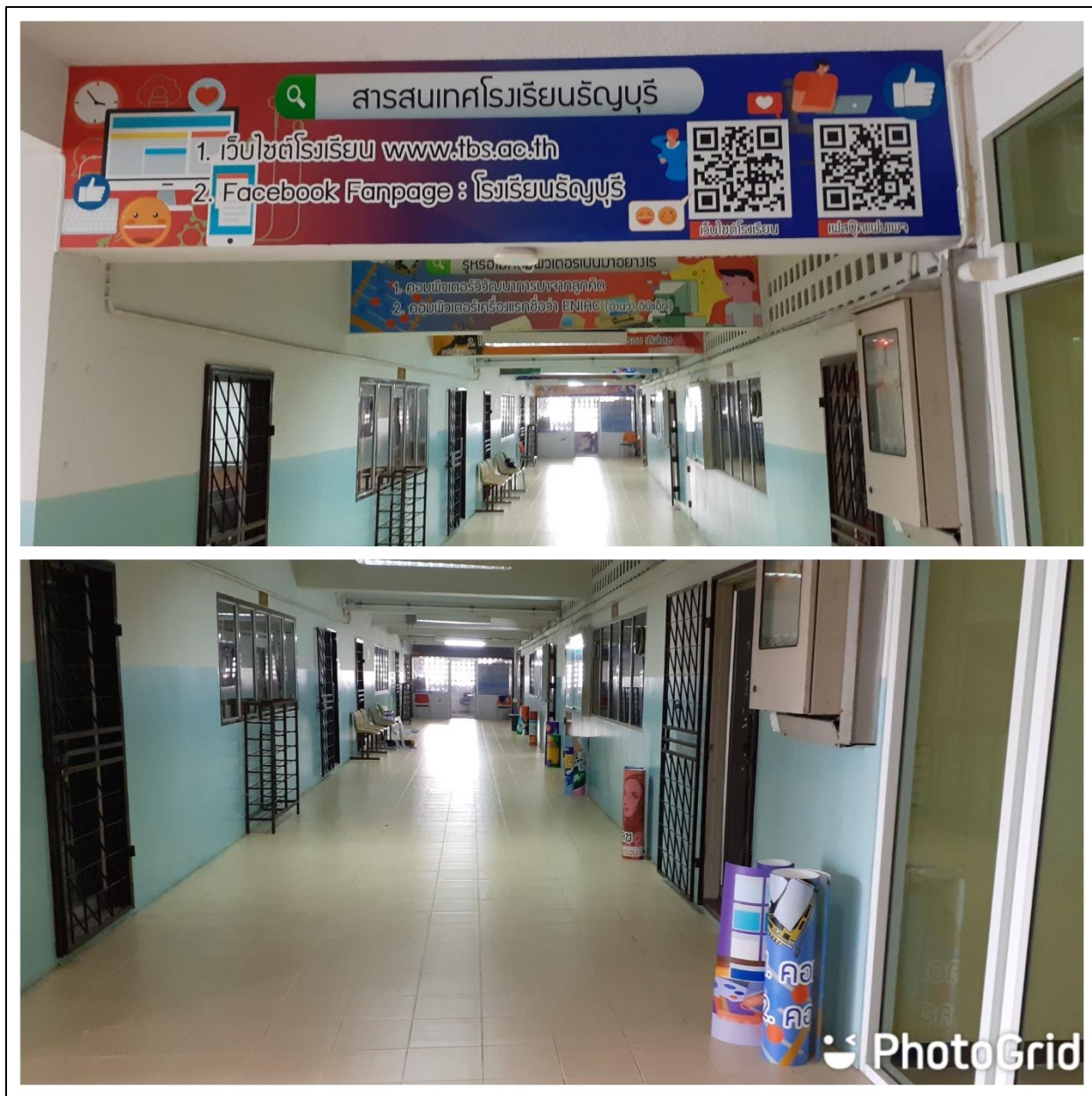
รูปที่ ๕ ตกแต่งภายนอกชั้นเรียนที่จัดการเรียนรู้ในรายวิชาคอมพิวเตอร์ ด้วยข่าวสารและเทคโนโลยีสมัยใหม่