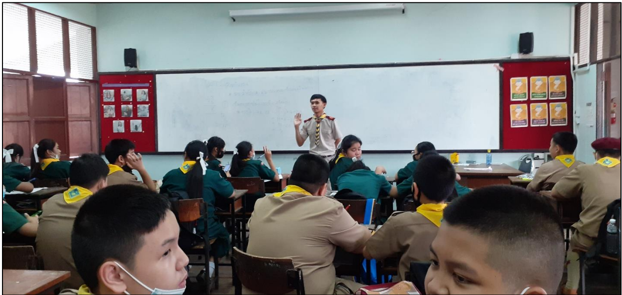
รูปที่ ๑๖ อบรมนักเรียนให้เป็นคนดี มีคุณลักษณะอันพึงประสงค์ที่ดี ทั้งในคาบลูกเสือและคาบโฮมรูม