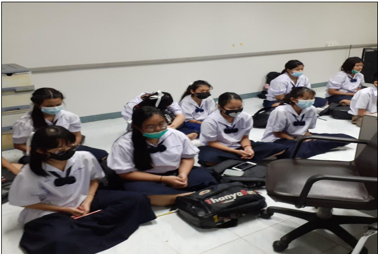
รูปที่ ๑๔ กิจกรรมนั่งสมาธิ

- การอบรมบ่มนิสัยให้ผู้เรียนมีคุณธรรม จริยธรรม คุณลักษณะอันพึงประสงค์ และค่านิยมที่ดีงาม