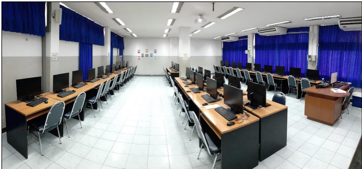
รูปที่ ๑ สภาพห้องปฏิบัติการคอมพิวเตอร์ สะอาดและปลอดภัย มีอุปกรณ์ทำความสะอาดช่วงของการระบาดของโรคโควิด ๑๙

- การจัดบรรยากาศที่ส่งเสริมการเรียนรู้ กระบวนการคิด ทักษะชีวิตและพัฒนาผู้เรียน