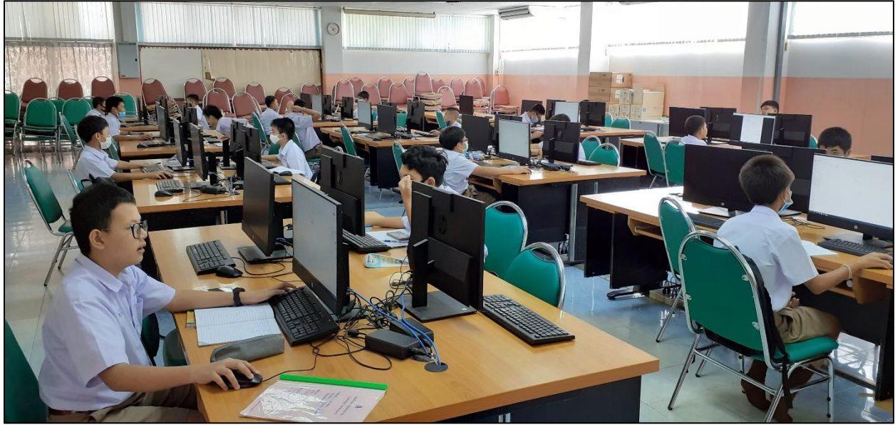
รูปที่ ๒ การเว้นระยะห่าง การจัดที่นั่งสำหรับนักเรียน