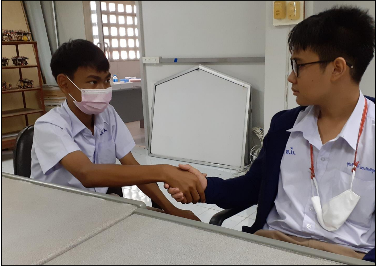
รูปที่ ๑๓ พูดคุยและร่วมกันหาแนวทางในการแก้ปัญหาการกลั่นแกล้งกันภายในชั้นเรียน