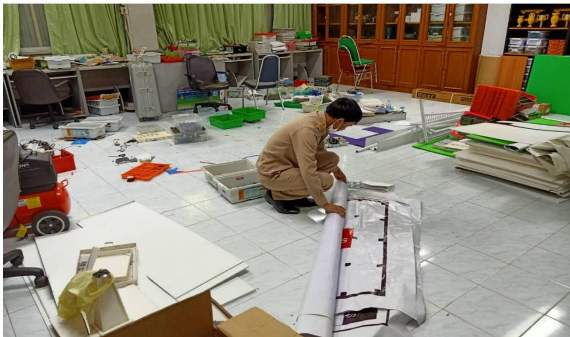
รูปที่ ๔ การทำความสะอาดและจัดเรียงอุปกรณ์ต่าง ๆ ภายในห้องปฏิบัติการหุ่นยนต์