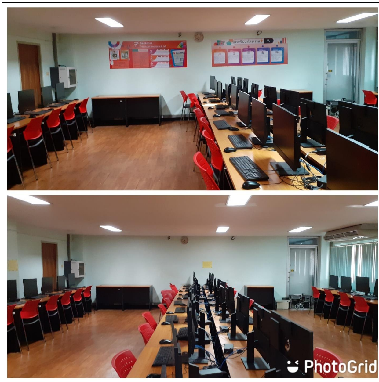
รูปที่ ๖ จัดบอร์ดความรู้ภายในห้องปฏิบัติการคอมพิวเตอร์