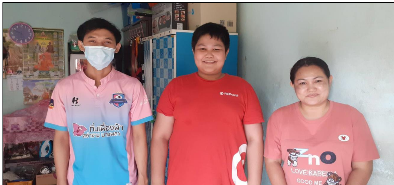
รูปที่ ๑๑ ออกเยี่ยมบ้านนักเรียน